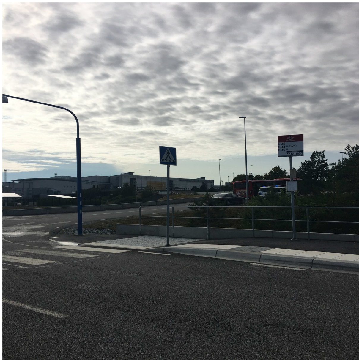
Bussen har kört förbi busshållplatsen och stannat som på bilden.